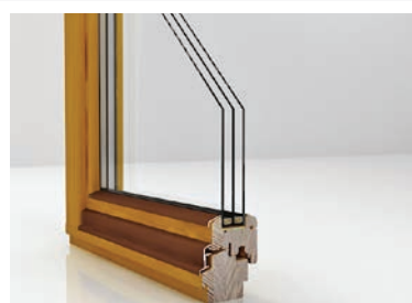
U okna nawet do 0,8 W/m 2 K

Produkt idealny dla klientów ceniących najwyższą jakość, naturalne piękno drewna i energooszczędne rozwiązania.